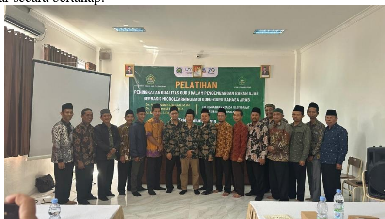
Pelatihan di MTsN Tulungagung

Microlearning terbukti sangat relevan dalam konteks pengajaran Bahasa Arab, karena mampu memecah materi kompleks menjadi segmen-segmen yang lebih kecil dan mudah dipahami. Bahasa Arab sering dianggap sebagai bahasa yang sulit dipelajari karena struktur tata bahasanya yang berbeda. Dengan pendekatan microlearning, guru dapat membagi materi menjadi topik-topik yang lebih spesifik, seperti kosakata atau aturan tata bahasa, yang memungkinkan siswa belajar secara bertahap.