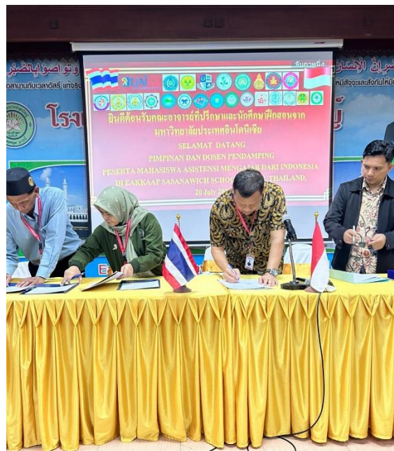
Gambar 1. Penandatanganan Kerja sama antara FBS UNJ dengan Direktur Eakkapapsasanawich Islamic School

Berdasarkan permasalahan di atas, analisis situasi yang dilakukan kepada Direktur Eakkapapsasanawich Islamic School, diperoleh beberapa informasi sebagai berikut: