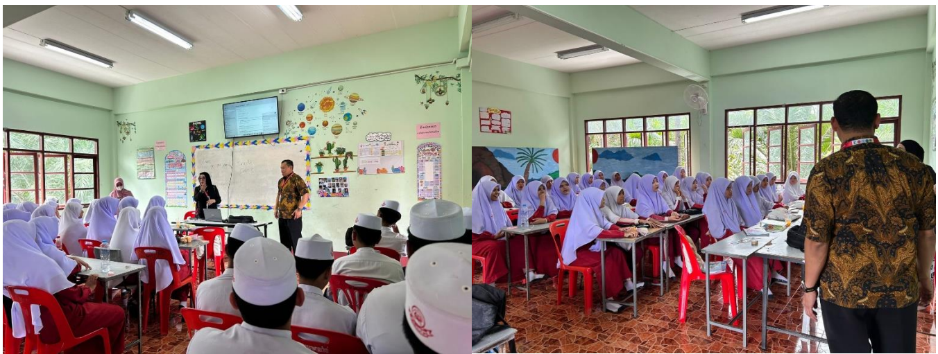
Gambar 3. Kondisi kelas pembelajaran siswa kelas 3 Sekolah Eakapapsasanawich

Pelaksanaan pembelajaran bahasa Arab bagi siswa SMP Eakapapsasanawich dilakukan pada siswa kelas 9. Pemilihan kelas ini dengan pertimbangan bahwa siswa sudah memperoleh pelajaran bahasa Arab sebelumnya saat di kelas 7 dan 8. Tim pelaksana PkM di awal memerlukan waktu cukup panjang untuk melakukan orientasi pembelajaran dan mempersiapkan kelas dengan memasang LCD projector sebagai media pembelajaran. Pelaksana PkM menyesuaikan kondisi yang baru ini dengan beberapa teknik pembukaan pembelajaran untuk menarik perhatian siswa dan mempersiapkan pembelajaran berikutnya.