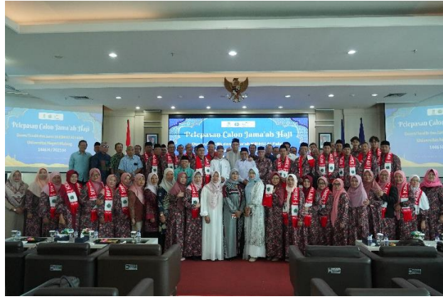
Gambar 4 Pelepasan Jamaah Haji oleh Rektor Universitas Negeri Malang

Sesi kedua adalah pelepasan resmi oleh Pemerintah Kota dan Kemenag Kota Malang di Lapangan Rampal, di mana jamaah KBIHU Al-Falah UM bergabung bersama ribuan jamaah haji Kota Malang lainnya dalam sebuah upacara yang agung. Momen ini menandai transisi status mereka dari calon jamaah menjadi tamu Allah yang siap berangkat. Dalam suasana tersebut, mereka diberangkatkan sebagai bagian dari Kloter 80, menempati Bus No. 7 dan sebagian di Bus No. 8, memulai perjalanan spiritual mereka dengan diiringi doa dari seluruh masyarakat yang hadir.