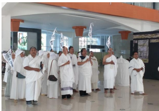
Gambar 3 Praktik Manasik Haji

Tujuan utama dari simulasi yang komprehensif ini adalah untuk membangun kesiapan mental dan menghilangkan culture shock serta kebingungan teknis yang sering dialami jamaah. Dengan merasakan langsung urutan perjalanan, transisi antar lokasi, dan praktik ibadah secara berurutan, jamaah dapat membentuk peta mental yang jelas. Hal ini secara signifikan mengurangi tingkat kecemasan dan meningkatkan kepercayaan diri mereka, sehingga saat berada di situasi yang sebenarnya, mereka dapat lebih fokus pada aspek spiritual ibadah daripada mengkhawatirkan hal-hal teknis.