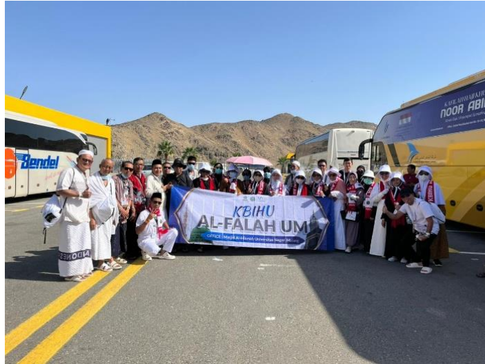
Gambar 6 Kebersamaan Jamaah Haji KBIHU Al-Falah