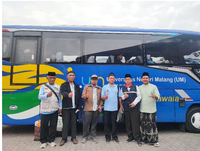
Gambar 7 Penjemputan Jamaah Haji