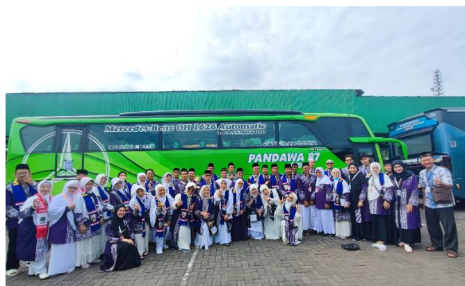
Gambar 5 Pemberangkatan oleh Pemerintah Kota Malang bersama dengan Kemenag Kota Malang

Dua sesi pelepasan ini memiliki makna simbolis yang mendalam. Pelepasan oleh rektorat menegaskan bahwa jamaah berangkat sebagai duta intelektual dan spiritual dari sebuah institusi pendidikan terkemuka. Sementara itu, pelepasan oleh pemerintah daerah mengukuhkan status mereka sebagai bagian dari komunitas masyarakat yang lebih besar. Kombinasi kedua seremoni ini memberikan penguatan mental dan spiritual yang luar biasa bagi jamaah, membuat mereka merasa didukung dan dihargai dari berbagai lapisan masyarakat.