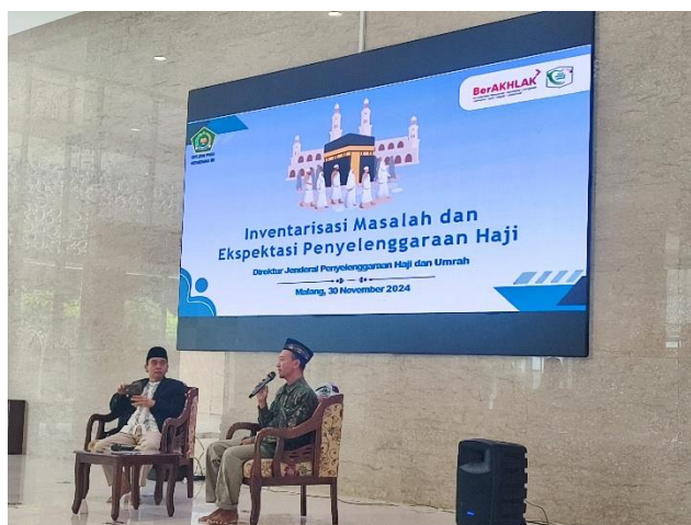
Gambar 2 Penyampaian Materi oleh Kemenag Kota Malang

Setiap sesi manasik dirancang secara interaktif, di mana pemandu acara tidak hanya berfungsi sebagai moderator, tetapi juga sebagai fasilitator yang mendorong diskusi dua arah. Selain itu, integrasi bimbingan doa-doa esensial di setiap akhir sesi menjadi ciri khas program ini. Jamaah tidak hanya diberi teks doa, tetapi dibimbing untuk melafalkan dan memahami maknanya, mulai dari Bacaan Talbiyah, Doa Melihat Ka'bah, hingga doa-doa spesifik saat Thawaf dan Sa'i. Pendekatan repetitif ini bertujuan untuk membangun kebiasaan dan kekhusyukan, sehingga saat berada di Tanah Suci, doa-doa tersebut dapat mengalir secara alami dari hati.