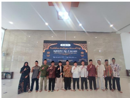
Gambar 1 Pra manasik

pemahaman yang umum dialami oleh calon jamaah haji. Hasil analisis ini menjadi dasar perancangan materi yang aplikatif dan relevan, memastikan bahwa setiap sesi bimbingan memberikan solusi nyata dan membangun kepercayaan diri peserta. Komitmen pada perencanaan yang detail ini menjadi faktor penentu utama keberhasilan tahapan-tahapan selanjutnya.